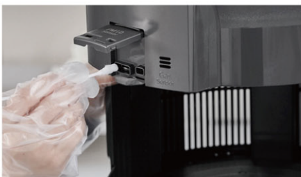
空氣品質感測器檢查