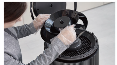
循環扇與內部清潔