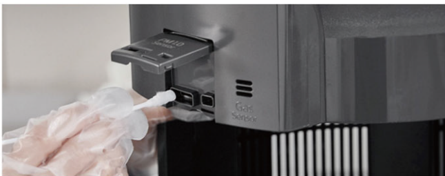
空氣品質感測器檢查