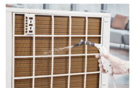
室外機清洗(不拆機) 44