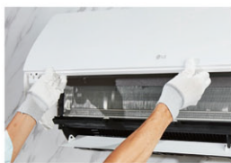
基本拆卸與清潔服務