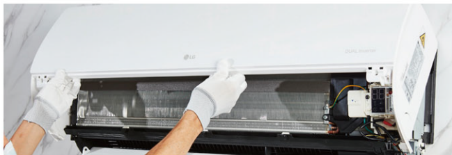
基本拆卸與清潔服務